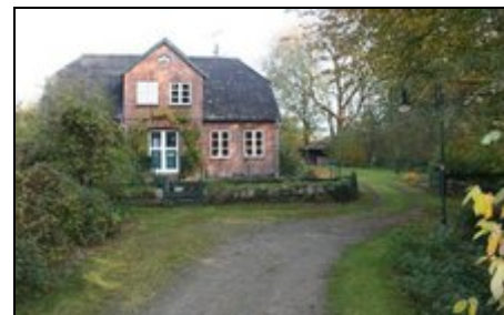
Der Weg zum Haus

Fahradtouren in der idyllischen Umgebung, Kanutouren auf der nahe gelegenen Trave, Golf spielen auf dem 18-Loch Platz des benachbarten Gutes Wensin, ausgedehnte Wanderungen, ein Besuch der Karl-May-Spiele, oder ein Strandtag an der Ostsee. Unterschiedlichste Aktivitäten sind möglich.