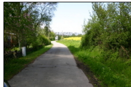
ruhige Strasse vor dem Haus

Nieby ist ein anerkannter Naherholungsort und wurde in der ersten Hälfte des 15. Jahrhunderts gegründet. Die Gemeinde hat 210 Einwohner und erstreckt sich von der freien Ostsee bis zur Geltinger Bucht. Zum Gemeindegebiet gehört das Naturschutzgebiet "Geltinger Birk", außerdem finden Sie vor Ort etliche Wander- und Radwege, die zu den schönsten Routen Deutschlands zählen.