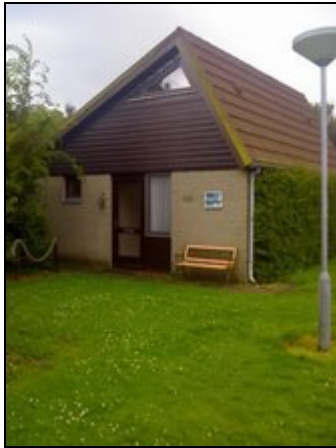
Aussenansicht mit großer Spielwiese

Freistehendes Ferienhaus mit uneinsehbarem Garten in einem grünen Park gelegen. Der weitläufige breite Strand ist in wenigen Minuten zu Fuß erreichbar