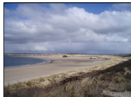
Strand bei Ellemeet und weitere 20 km

Das Haus befindet sich in dem kleinen Dorf Ellemeet, zwischen dem bekannten Dorf Renesse und dem am Grevelingenmeer gelegenen Dorf Scharendijke, 800 m vom Nordseestrand/Brouwersdam und 1km vom größten Salzwasserbinnengewässer Europas entfernt. Die Insel bietet alle erdenklichen Sportarten wie z.B. Surfen, Tauchen, Angeln, Kitesurfen, Segeln, Wandern und Reiten in einer einzigartigen Naturlandschaft. Unendliche Naturschutzgebiete die zu Fuß, Fahrrad oder Pferd von Ihnen erkundet werden möchten.