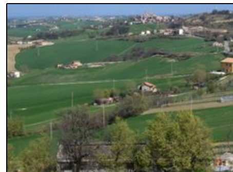
Bildmitte: Casa del Sole von Barchi aus

Das freistehende Ferienhaus liegt am Ortsrand von Barchi, in der Nähe von Orciano und Mondavio. Die Entfernung zum Meer beträgt mit dem Auto ca.25 Minuten. Es bieten sich zahlreiche Ausflugsmöglichkeiten an, z.B. nach Urbino, Senigallia, Gubbio(Umbrien), Rimini, Ravenna, Bologna. Auf dem nahe gelgenen Monte Catria(1700m)können Sie die Bergwelt des Apennin kennen lernen und einen atemberaubenden Ausblick genießen. Vielfältige Einkaufsmöglichkeiten und zahlreiche Restaurants sind vorhanden.