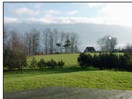
Blick von Anjas Hus

Unweit des Ferienhauses kann man im Hafen von Mommark frischen Fisch kaufen oder selber angeln. Die langgestreckte Insel Als liegt im Süden Jütlands kurz hinter der Grenze, ist sehr vielseitig und bietet sich von daher sowohl für kürzere als auch für längere Aufenthalte an. Die hügelige Insel bietet vielfältige kulturelle Möglichkeiten sowie Besichtigungen von Schlössern, Kirchen, Ruinen und Gedenkstätten. In dem Museum, welches sich im Schloß von Sønderborg befindet, findet man Ausstellungen zu