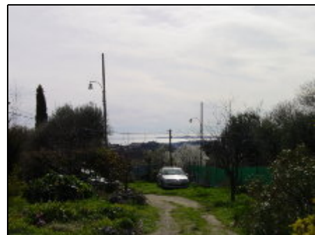
Teil des Grundstücks mit Meerblick

Das Haus liegt im Ortsteil St. Roman de Bellet in absoluter Ruhiglage mit Bäumen, Blumen und Palmen und ist der ideale Ort für totale Erholung. Den Strand erreichen Sie in 8 Autominuten, die Innenstadt in 10 Autominuten. Einkaufsmöglichkeiten (Bäcker, Metzger, Supermarkt etc.) befinden sich in 2 km Entfernung, Bushaltestelle in 250 m Busfahrt 1 Euro bis Monaco und Cannes), wunderschöne Spaziergänge in den Colines und zur nahegelegenen Weindomäne von Bellet möglich,