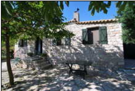
Der Eingang zum schönen Steinhaus

Wir vermieten unser Steinhaus mit Pool von privat in herrlicher Alleinlage und Traumaussicht, welches in einem wunderschönen Garten mit Pool liegt ..