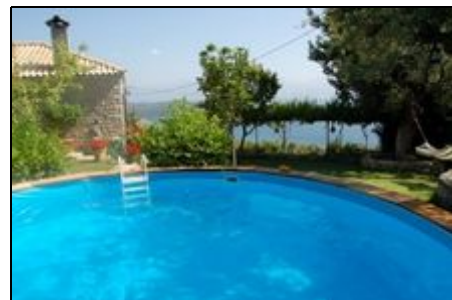
Der schöne Pool im großen Garten

In dem kleinen Fischerdörfchen Paralia Sergoulas urlauben Sie abseits des Touristenrummels. 1 Bäcker, fahrende Händler und schöne Tavernen, sowie Strandbars runden das alternative Urlaubsangebot ab. Traumhafter Kieselstrand und kristallklares Wasser erwarten Sie. Gerne können Sie bei uns auch Ihren Hund auf Erholung mitnehmen. Es versteht sich von selbst, dass sich Kinder hier besonders wohlfühlen.