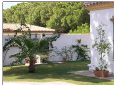
Garten am Casa Alhambra

Diese moderne Villa in der Nähe von Chiclana de la Frontera bietet Platz für 6/8 Personen. Das Haus hat einen hübschen eigenen Garten mit Swimmingpool inmitten eines Pinienwaldes. Dennoch ist das Haus nicht weiter als 1.5 km von Geschäften und dem weißen Sandstrand von La Barossa Beach entfernt, einem der feinsten und saubersten Strände Europas, und mitunter der Beste von ganz Spanien. Dieser fantastische Strand wurde mit der Blauen Flagge ausgezeichnet (eine Auszeichnung für saubere Strände).