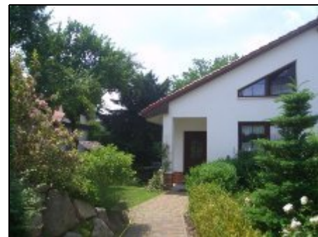
Weg zum Eingang

Berlin-Köpenick bietet viel Wald und zahlreiche Flüsse und Seen für schöne Ausflüge ins Grüne. Die Altstadt hat ein Insel Schloss mit Kunstgewerbemuseum, ein sehenswertes altes Rathaus (Hauptmann von Köpenick), zwei kleine Theater, Heimatmuseum u.v.a. Von den Dampferanlegestellen fahren die Ausflugsschiffe innerhalb Berlins und auch aus Berlin heraus. Mit der in der Nähe gelegenen S-Bahn erreicht man in ca. 35 Minuten die City von Berlin mit all den Sehenswürdigkeiten.