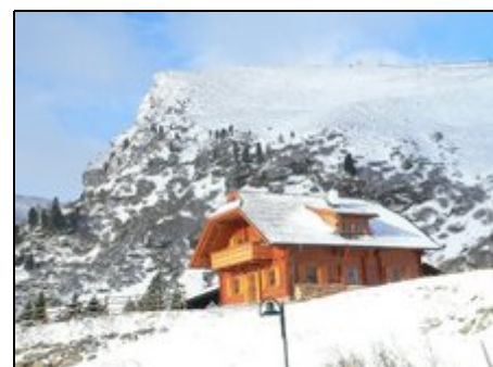
Chalet Panorama im Winter

Im Nationalpark Nockberge liegt das Almdorf Falkertsee (Seehöhe 1750 m - 1850 m) in der Nähe von Bad Kleinkirchheim und dem Millstätter See. Für Ihre Wellness haben Sie beste Voraussetzungen in den Thermalbädern von Bad Kleinkirchheim. Neben dem Skigebiet Falkertsee sollten Sie sich die einmaligen Abfahrten der Turracher Höhe, St. Oswalds und von Bad Kleinkirchheim nicht entgehen lassen. Im Sommer werden Sie die Wanderungen in dem Naturschutzpark Nockgebirge genießen.