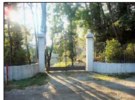
Einfahrt zum Rustico

Vignone ist ein kleiner Ort unterhalb Agra. Agra, auch als Luftkurort bekannt, ist ein malerischer, idyllischer Ort, oberhalb von Luino und wegen seiner Lage und landschaftlicher Umgebung eines der schönsten Dörfer in diesem Gebiet. Agra, auch "die Sonnenterrasse über dem Lago Maggiore" genannt, bietet mit seinen schönen Buchen - und Kastanienwäldern, der tollen Aussicht über See und Berge und seiner idealen Lager zur Schweiz viele Möglichkeiten für einen erlebnisreichen und erholsamen Urlaub.