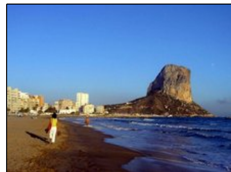
Peñon de Ifach, der Hausberg von Calpe

Das private Ferienobjekt liegt ruhig am Ende einer Sackgasse in der gepflegten Siedlung Gran Sol in Calpe, im schönsten Teil der Costa Blanca, bekannt für wunderbares Wetter das ganze Jahr über. Entlang der Küste gibt es kilometerlange Sandstrände und unzählige kleine Buchten mit kristallklarem Wasser. Eine Vielzahl von Wassersportmöglichkeiten und Ausflüge, z.B. ins nahe bergige Hinterland zu romantischen Bergdörfern inmitten von Orangenplantagen erwarten den Besucher.