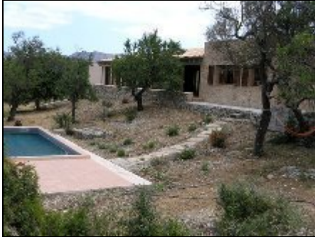
Finca Katalina mit Pool

Diese Finca wird vermittelt durch MIV. Die neu erbaute Finca liegt in schöner hügeliger Landschaft in der Nähe von Arta. Der gr. Pool lädt zum Baden ein.