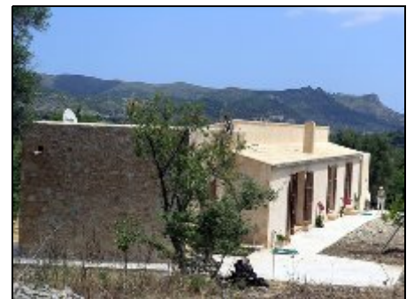
Frontansicht Finca Katalina bei Arta

Die Finca liegt nur ca. 2 km von Arta entfernt. Dort gibt es Restaurants, Bars und Einkaufsmöglichkeiten. Die nächsten Strände liegen ca. 8 km entfernt. Nach Cala Ratjada sind es ca. 12 km. Ihre Vermittlungsagentur MIV-Ferienimmobilien GmbH berät Sie gern.