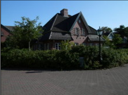
Haus am Südstrand

Doppelhaushälfte im Stil eines friesischen Haubargs, modern, ruhig am Kurpark und nahe am Südstrand und am "Weltnaturerbe" Wattenmeer gelegen (3 Min.)