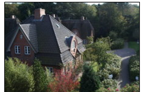
der Weg durch den Kurpark zum Strand

Das Haus liegt ideal in nahezu autofreier Zone. Zum Strand 3 Min.zu Fuß durch den Kurpark. Wyk-Zentrum 5 Min. mit dem Fahrrad , Golfplatz ebenso. Reiten möglich. Nebenan das Pfannkuchenhaus: Kaffeetrinken, super Eis u. Kuchen, kleine Mahlzeiten, schöner Rosengarten. Zum Hafen 10 Min., zum Meerwasserschwimmbad 3 Min.. Ausflüge nach Sylt, Amrum, Halligen, Hooge, Wattwandern, Radfahren, großes Sportangebot und viel Natur. Außerhalb der Hochsaison: Vogelzug, Winterlandschaft am Meer, danach Sauna