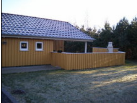
die Ansicht von der Straße