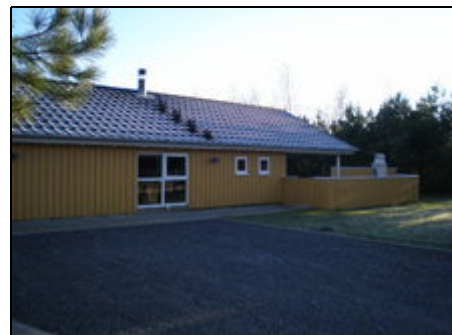
Ferienhaus Carstensen - gelb -

Abstand zum Kaufmann ca. 200 m (Luftlinie).