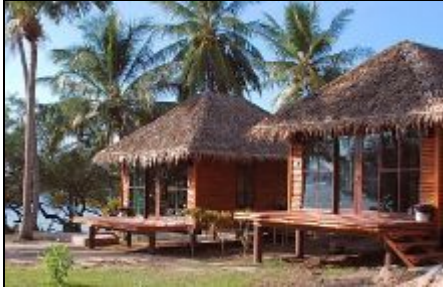
Bungalows - Sabai Beach Resort

Das Sabai Beach Resort auf Ko Phangan im Golf von Thailand bietet Bungalows zur Miete direkt am Strand, für einen erholsamen und entspannten Urlaub.