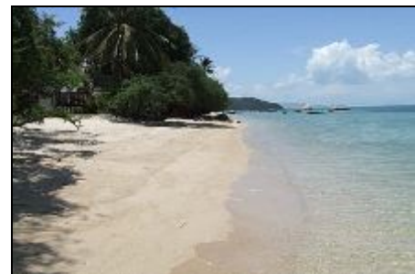
Strand - Sabai Beach Resort

Ko Phangan bietet dem Urlauber ruhige und abgelegene Strände zur perfekten Erholung und Entspannung. Auch Freunde des Tauchsports kommen auf Ko Phangan auf ihre Kosten, denn rund um die Insel gibt es zahlreiche schöne Tauchgründe und vorgelagerte Korallenriffe. Die Nachbarinseln Ko Samui und Ko Tao sind bequem per Fähre oder High Speed Katamaran zu erreichen. Die Hauptstadt von Ko Phangan heißt Thongsala und ist wichtigster Hafen der Insel.