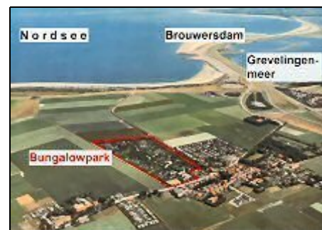
Lage des Bungalowparks

Das Ferienhaus gehört zum Bungalowpark "De Haerde", in dem Dörfchen Ellemeet, gelegen zwischen Renesse und Scharendijke. Der gepflegte, ruhige Park ist mit grosszügigen Spielwiesen, viel Grün, Kinderspielplatz, sowie Tennisplätzen und Waschmaschinen/Trockner bestens ausgestattet und liegt nur 800m vom schönen Nordseestrand und dem nur durch den Brouwersdamm getrennten Grevelingenmeer, dem grössten Binnenmeer der Niederlande. Zeeland hat nachweislich die meisten Sonnenstunden in NL.