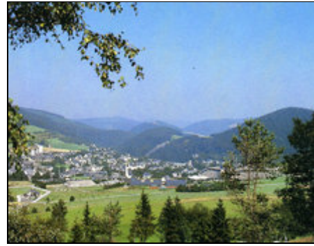
Willingen: Ihre Urlaubswelt ganzjährig

Willingen liegt im Sauerland (Upland). 700 m über NN. Weitere Informationen unter "Eigene Homepage" (siehe unten). Sie wohnen mit herrlichem Blick in die Landschaft auf einem großen Grundstück in ruhiger Lage am Waldrand in Willingen-OT Bömighausen. Ca 15 Gehm. nur ist der idyllische Bade- und Angelsee vom Schwedenhaus entfernt.