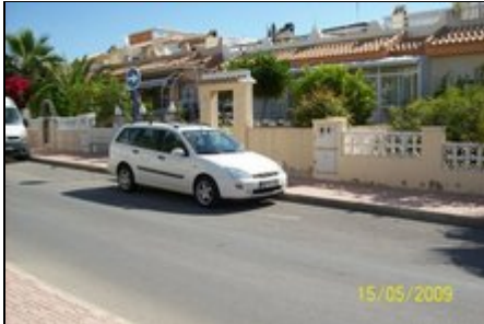
Haus mit Auto und Wintergarten

Ferienhaus mit Auto schon ab 35,- € pro Tag zu vermieten ... ACHTUNG kurzfristig Werbeaktion 02.10. -23.10.11- 3Wochen mieten und nur 2Wochen zahlen