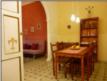
Wohnbereich EL ARCO

Neu renoviertes Altstadtsthaus, ruhig im historischen Zentrum Jerez de la Fronteras gelegen, mit 9 abgeschlossenen Wohnungen (Belegung: 1-38 Personen).