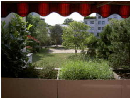
Blick von der Terrasse zum Innenhof

Ruhige, gepflegte Terrassenwohnanlage in Wassernähe (Havel/Pichelssee/Scharfe Lanke/Bocksfelder Bucht) unmittelbar neben den "Thermen am Pichelssee".