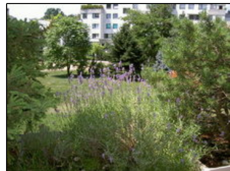
Lavendelblüte - der Duft des Sommers

Nur 3 Minuten zu Fuß von der Heerstraße an der Freybrücke entfernt. Beste Busverbindungen (M49, X49 und X34) Richtung Innenstadt (Bahnhof Zoo) und Spandau-Altstadt (Bus 136/236) zur Fern-/S-/U-Bahn. Taxistand in unmittelbarer Nähe. Gepflegte Restaurants, Sauna mit Schwimmbad und Medizinischen Massagen ("Thermen am Pichelssee") sowie vielfältige Einkaufsmöglichkeiten im nahen Umfeld, unweit der Schulungseinrichtungen von IG-BAU u. IG-Metall, sowie des DLRG Landesverbandes Berlin am Pichelssee.