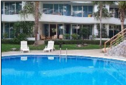
Blick auf das Apartment