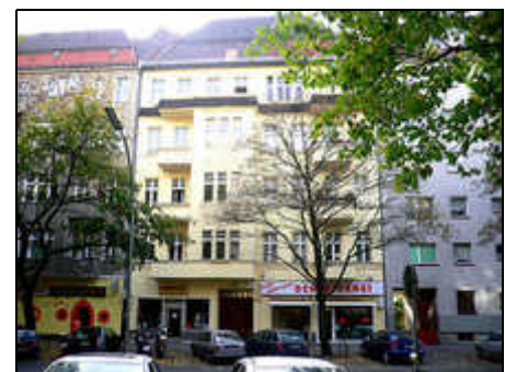
Ansicht Kaiserin Augusta Allee

Besonders reizvoll sind die historisch gewachsenen Quartiersstrukturen aus unterschiedlichen Epochen sowie vielfältige + erlebnisreiche Straßen. Einladende Straßencafés, individuelle Geschäfte und ruhige Uferspazierwege erzeugen einen hohen Wohnwert.