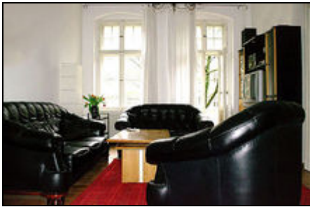
Wohnzimmer Kaiserin Augusta Allee

Geräumige, gut eingerichtete Altbauwohnung in Laufnähe zum Schloß Charlottenburg für max. fünf Personen.