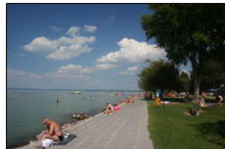
Frestrand, 100 m vom Haus

Das Holiday House liegt in Siófok, in der grössten Stadt des Plattensees. Es befindet sich in exponierter Lage des sogenannten "Goldufers". Das Ferienhaus steht auf einem grossen Grundstück von 1200 qm, 150 m vom Plattensee entfernt im Badeort Siófok. Einkaufsmöglichkeiten in unmittelbarer Nähe. 2 Tennisplätze, Fussball und Basketballplatz sind gleich über der Strasse.