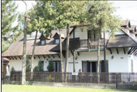
Holiday House vorne

4 Appartement im Holiday House für 4-5-6 oder 7 Personen! Kinderfreundlich -kostenloser Babybett, Badewanne, K.hochstuhl! Grosses Garten mit Parkplatz