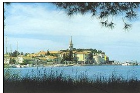
Novigrad Stadtbild - Zentrum

Die Villa bietet unseren Urlaubsgästen einen "autofreien" Ferienaufenthalt, da die Strandbereiche sowie alle Versorgungseinrichtungen, Einkaufsmöglichkeiten und Restaurant's fußläufig zu erreichen sind.