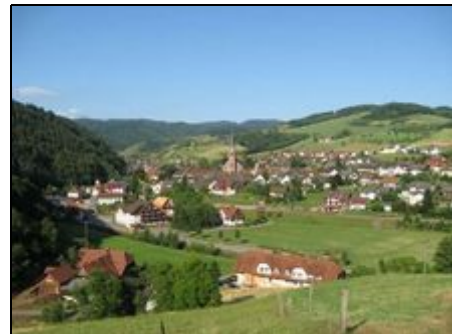
Blick auf unser Haus und Ortsansicht

Mit unserer Gästekarte - Konus - können Sie mit Bahn und Bus kostenlos z.B. nach Freiburg, Basel, Titisee und Schluchsee, Freudenstadt, Rastatt Baden-Baden, die Schwarzwaldbahn bis Donauschingen, Straßbourg (ist frei bis Kehl), Europapark-Rust, etc. fahren. Gute Bahnanbindung. Wir befinden uns ca. 2 Min. vom Bahnhof (nur Nebenbahn trotzdem ruhige Lage).