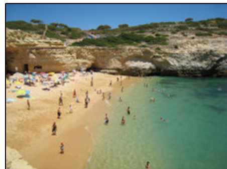
eine der tollen Buchten vor der Haustür

Genau im Herzen der Algarve, in Porches / Armação de Pêra liegt diese großzügige Villa mit Garten. Eine traumhafte Küstenregion mit bizarren Felsformationen + kleinen Badebuchten, sowie ein kilometerlanger Sandstrand vor der Haustür. Die Vivenda das Palmeiras liegt direkt an der Straße, die in den Ort (ca. 2,5 km) und zum ca. 8 km langen Sandstrand von Armação de Pêra führt. Hinter dem Haus haben Sie Ihre gewünschte Ruhe und können ganz ungestört Ihren Urlaub genießen!