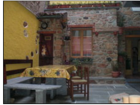
Innenhof mit Eingang vom La Bella

Brusimpiano ist ein kleiner Ort mit 1.000 Einwohnern. Er befindet sich 5 km hinter der Grenze Ponte Tresa, Schweiz/Italien. Es gibt dort versch. Bars und Restaurants, eine Eisdiele und einen kleinen Supermarkt für das Nötigste. In den nahe gelegenen Orten Ponte Tresa und Porto Ceresio gibt es große Supermärkte, viele Restaurants und Pizzerien direkt am See. Die Gegend um Brusimpiano bietet für jeden Geschmack etwas: Berge, Seen, kleine Bergdörfer, große Städte.