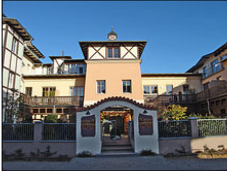
Residenz Seestern in Kühlungsborn

Gemütlich und komfortabel Wohnen auf 60qm und nur 5 Gehminuten vom Strand entfernt. Eine feine Adresse direkt an der Ostsee.