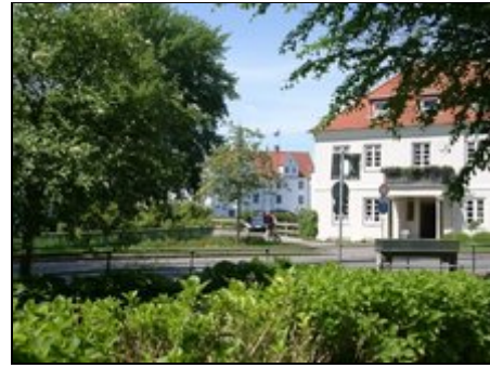
Blick vom Grundstück auf das Schloss

Durch die Nähe zum Wasserschloss wird das Gästehaus gerne von Hochzeitsgästen genutzt. In wenigen Minuten Spazierweg sind das Rosarium, die Therme oder auch der Artefact Powerpark zu erreichen. Auch die Stadt Flensburg mit den restaurierten Kaufmannshöfen ist einen Besuch wert. Sollte einmal kein Strandwetter sein, laden Schiffahrtsmuseum, das SumSum (Indoorspielpark), die Phänomenta, die Flensburger Museen und natürlich die Therme mit seinen verschiedenen Saunen zu einem Besuch ein.