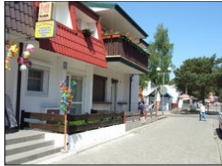
Fußgängerzone Blick zum Strandweg