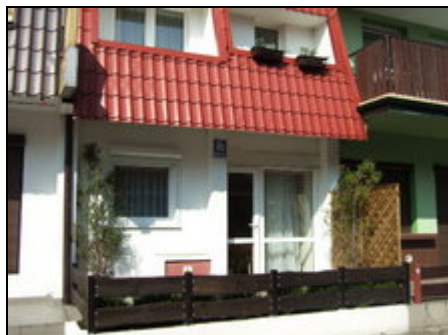
Vorderfront des Hauses

Komfortables Apartment (40 qm) für 1-4 Personen im 1.Stock,Wohn./Schlafzimmer, Küche, Bad, SAT-TV, Strand 200 m, Geschäfte und Restaurants in der Nähe