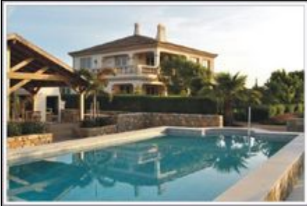
Quinta Sol e Mar

Die stilvolle Quinta im Naturschutzgebiet Ria Formosa ist umgeben von einem herrlichen Garten mit Pool & Obstplantage. Der Atlantik ist greifbar nah!