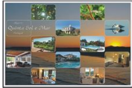
Rund um die Quinta Sol e Mar