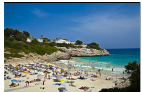
Die Cala Anguila

Die Anlage liegt sehr nahe (zu Fuß erreichbar) zu den Sandbuchten der Cala Anguila und auch Cala Mandia in zentraler und doch absolut ruhiger Lage. Einkaufsmöglichkeiten sind bequem zu Fuss in ca. 500 m erreichbar. Eine Bushaltestelle liegt eine Strasse weiter. Restaurants sind in wenigen Gehminuten ebenfalls zahlreich vorhanden. Die absolute Topanlage in Toplage. Porto Cristo mit seinen weit bekannten Drachenhöhlen ist in 3 km Entfernung zu erreichen, 5 Golfplätze innerhalb von 15 km.