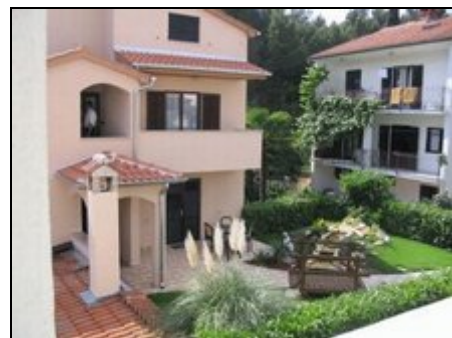
Eintritt im Apartment

Apartment Rakovac befindet sich in sehr ruhiger und schöner Zone. Im diesem Haus gibt es noch 4 Apartment für 2-5 Personen. Diese ist eine Zone mit familien Häusern und grossen Garten. Es ist nur 700m zum Zentrum Porec und ersten Stränden entfernt. Man kann im 10-15 Minuten zu Fuss alles erreichen. Die Stränden sind Kiesstrände mit vielen Sportaktivitäten; Tennis, Volleyball, Tauchen, Mini Golf.. In der Nähe da sind viele Geschäfte, Supermarkt, Restaurants usw.