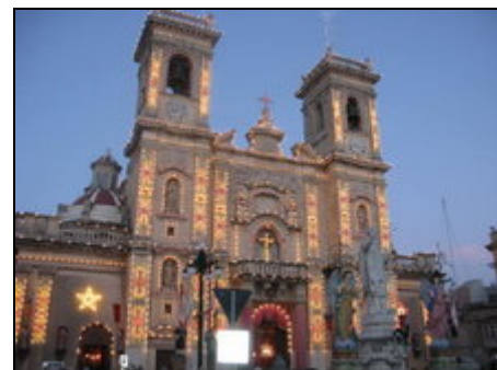
Haz-Zebbug Parish Church

Haz-Zebbug ist ein typisches maltesisches Dorf auf der Insel Malta - einem großen Ort von wo aus alles zu erforschen ist, was Malta anbietet. Viele historische Stätten, Museen, Nachtleben und Strände sind in der Nähe. Ein Leihwagen wird empfohlen. Busse fahren täglich von Haz-Zebbug nach Valletta (alle 20 Minuten). Valletta: 7 km, Mosta Kuppel: 3,5 km, Mdina: 3 km, Goldene Sandstrände: 8 km, Ghar Lapsi Strand: 7 km, Sliema: 7 km, Dingli Klippen: 7 km, Flughafen: 7 km.