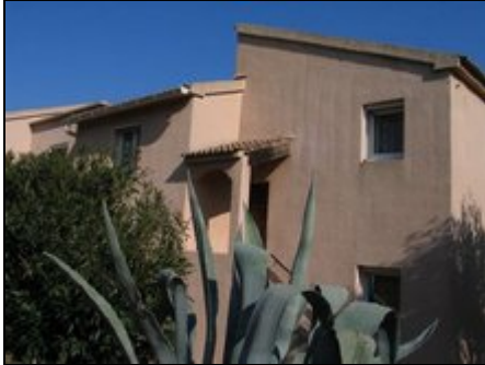
Umgeben von Grün

ILE ROUSSE: Ferienwohnung mit außergewöhnlichem Komfort. Überwältigender Panorama-Meerblick vom Balkon: Cap Corse. Zentral gelegen und ruhig.