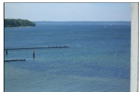
traumhafter Ausblick vom Balkon

Die Wohnung liegt in Schausende auf der Halbinsel Holnis. Natur pur.