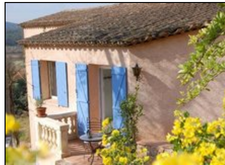
Separater Eingang von Appartement 2

Hier zwischen den berühmten Stränden von St. Tropez und dem spektakulären Canyon du Verdon: große Wälder, uralten Dörfer mit Bauernmärkten. Hier geht noch alles nach der großen Ruhe der duftenden Natur: Wandern, Radfahren, Reiten, Schwimmen, Golf oder Boule, Segeln, Weingüter abschmecken, - träumen und genießen! Nizza, Monte Carlo, Grass und Aix sind nah, Restaurants und Supermärkte schnell erreichbar. Was weniger bekannt ist: DER BESSERE SOMMER IST HIER DER HERBST - warmes Badewasser bis Nov.!