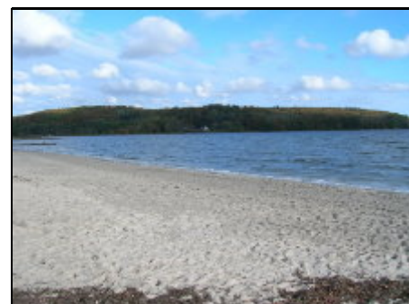
Strand von Wassersleben

Das Apartment liegt ca. 100 m vom wunderschönen Strand in Wassersleben entfernt. Hier kann man im Sommer am feinsandigen Strand wunderbar relaxen oder in der flachabfallenden Ostsee-Förde baden. Der direkt angrenzende Wald lädt zum spazieren gehen ein. Ein Minigolfplatz ist auch vorhanden. In der näheren Umgebung kann man angeln, oder mit dem Fahrrad die wunderschöne Gegend erkunden. Linienbusverbindungen in die Foerdestadt Flensburg (3km) sind vorhanden. Dänemark ist auch nicht weit (1km)