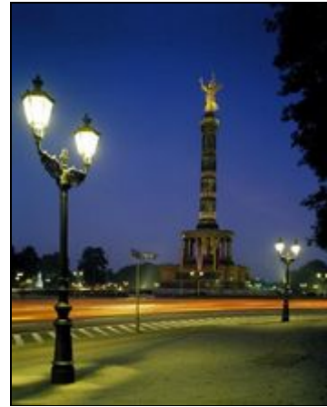
Berlin bei Nacht